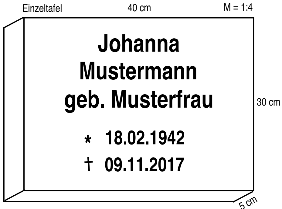
Einzeltafel: Musterbeschriftung Urnenreihengrab im Urnenfeld